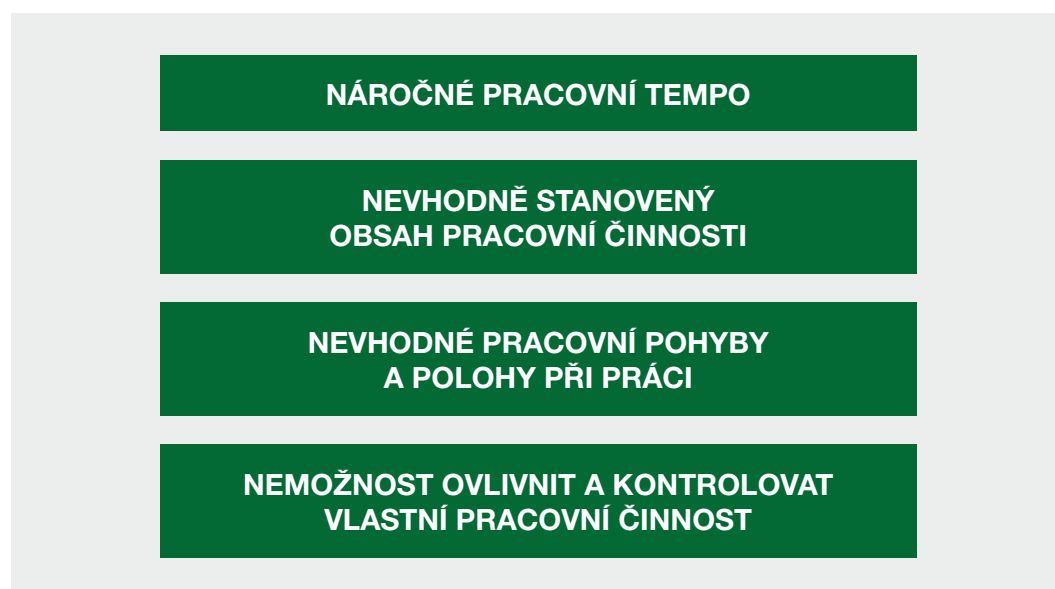
Obr. 2 Nejexponovanější faktory rizika MSD

MSD mají do značné míry souvislost s nesprávnou organizací práce, o čemž svědčí a potvrzují to čtyři nejexponovanější faktory rizika MSD, které se při pracovní činnosti vyskytují, jak uvádí obrázek č. 2.